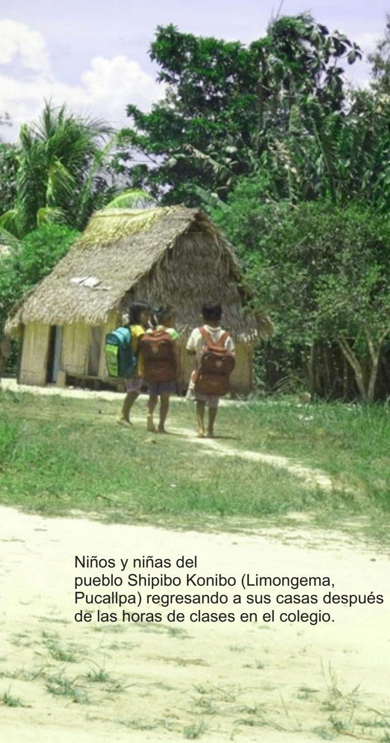
Niños y niñas del pueblo Shipibo Konibo (Limongema, Pucallpa) regresando a sus casas después de las horas de clases en el colegio.

extinción debido a que solo entre 1 y 11 personas las hablan.