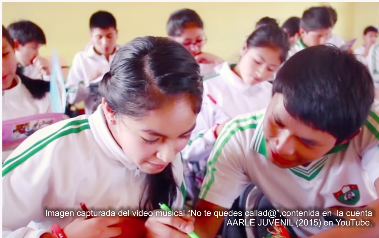
Imagen capturada del video musical "No te quedes callad@", contenida en la cuenta AARLE JUVENIL (2015) en YouTube.

Pese al desinterés, a la indiferencia y a la desatención del marco normativo por